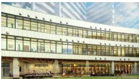
▲認定こども園が開園するA棟外観イメージ