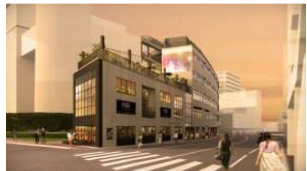
▲B棟外観イメージ(代官山駅側)