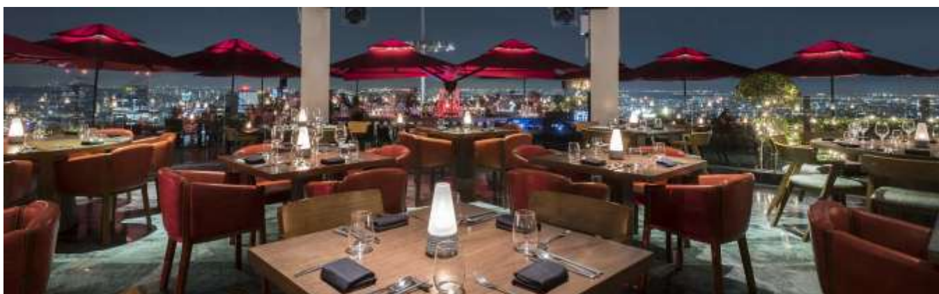
「CÉ LA VI Singapore」Marina Bay Sands