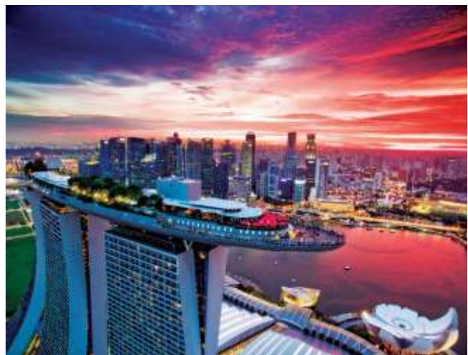
「CÉ LA VI Singapore」 Marina Bay Sands

当社は、2019年秋に竣工予定の東急プラザ渋谷を「MELLOW LIFE(メロウライフ)」を提案する場として、「都会派の感度が成熟した大人たち」をターゲットに、新時代に向けた商業施設を計画中です。