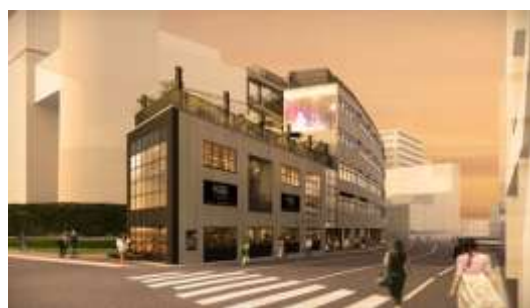
▲B棟外観イメージ(代官山駅側)