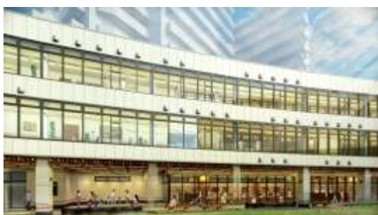
▲認定こども園が開園するA棟外観イメージ

当社は、渋谷ストリームや官民連携による渋谷川の整備とともに本計画を推進し、渋谷～代官山の渋谷駅南側エリアの回遊性を高めることで、広域渋谷圏の魅力向上や、渋谷が「日本一訪れたい街」となることを目指します。