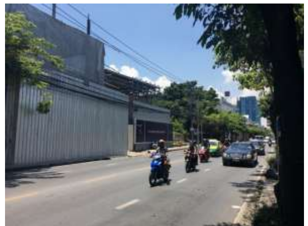
▲第2弾プロジェクト計画地周辺の様子