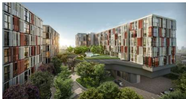
▲「taka HAUS(タカハウス)」外観イメージ

2017年8月、Sansiri社、サハ東急とともに「Siri TK One Company Limited」を設立し、バンコク・スクムビット地区において、コンドミニアムプロジェクト「takaHAUS」に着手しました。このプロジェクトは、都心に通勤するタイ人や、外国人駐在員への賃貸を目的とするタイ人・外国人投資家などをメインターゲットとした269戸のコンドミニアムで、2019年度の竣工を予定しています。Sansiri社のブランド力やノウハウとともに、多摩田園都市などのまちづくりで培った、当社のノウハウを生かしたライフスタイルをお客さまに提案します。