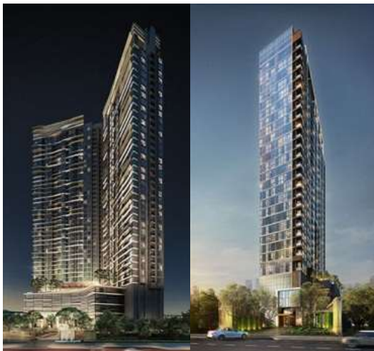
▲BTS社との合弁事業 Lineシリーズ

※約1,176億円=5月10日(木)時点のレート1THB=3.42円(TTM)で計算