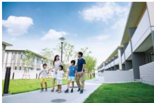
▲敷地内での歩車分離や緑豊かな遊歩道