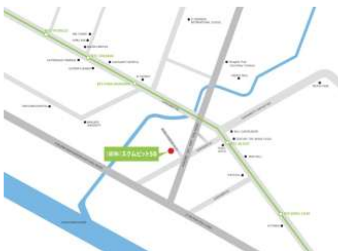
▲第3弾プロジェクト所在地