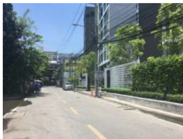
▲第3弾プロジェクト計画地周辺の様子