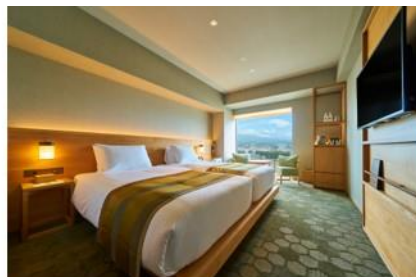
富士山三島東急ホテル