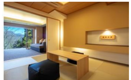
東急バケーションズ箱根強羅