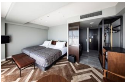
渋谷ストリームエクセルホテル東急