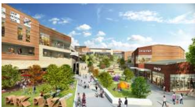
▲隣接する鶴間公園につながる自然豊かな広場イメージ