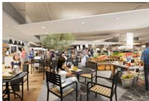
▲「食」のエンターテイメント空間イメージ