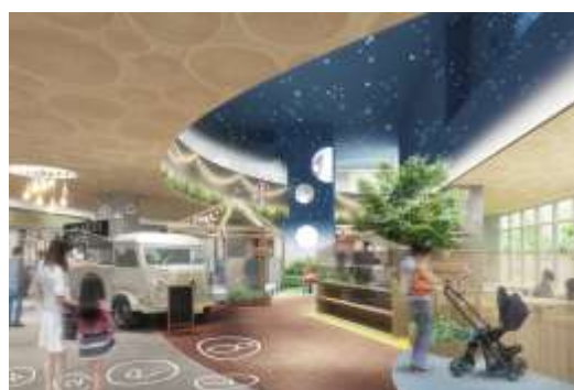
▲「遊び」のエンターテイメント空間イメージ