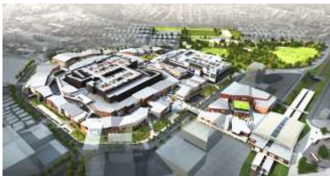
▲本計画 俯瞰イメージ