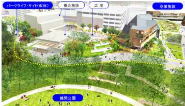
▲パークライフ・サイト(仮称)イメージ(鶴間公園側から見る)

「パークライフ・サイト(仮称)」を中心に、まち全体を一体的に活用したイベントやワークショップも展開し、繰り返し訪れたい新しいにぎわいを創出します。