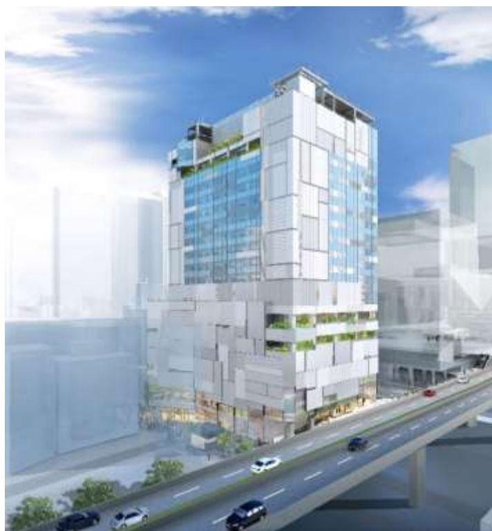
外観(南西側) イメージ