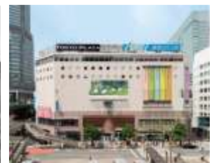
2015年閉館前の 「東急プラザ渋谷」