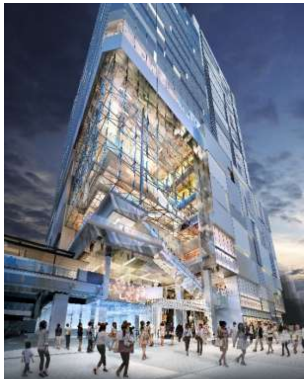
アーバン・コア イメージ