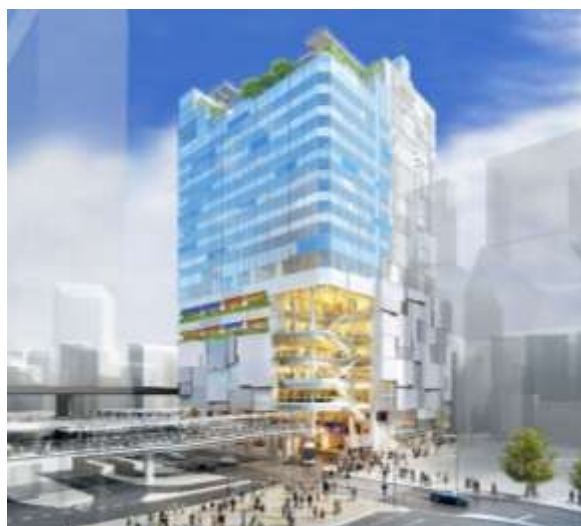
外観（北東側）イメージ