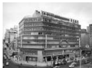
1965年開業当初の 「渋谷東急ビル」

1965年6月13日に専門店複合商業ビルの「渋谷東急ビル」として渋谷駅前に開業。その後、1973年に「渋谷東急プラザ」に、2012年に「東急プラザ渋谷」に名称を変更しながら、2015年3月22日の閉館まで、49年間に渡り営業を続けました。ファッションからレストラン、生鮮食品まで備える老舗テナントビルとして、渋谷を訪れるお客様に長年愛されてきました。