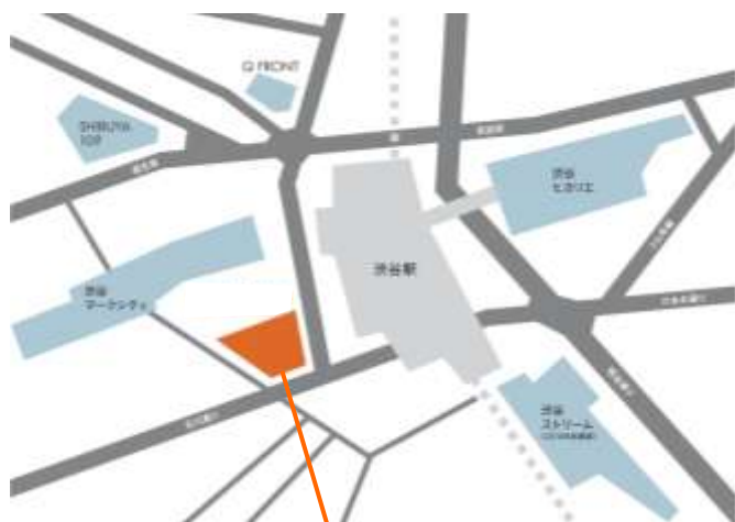
計画地 東急プラザ渋谷 (道玄坂一丁目駅前地区内)