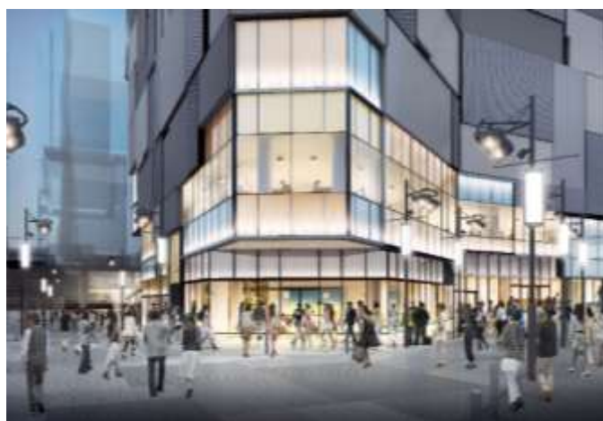
周辺街路整備(北西側) イメージ