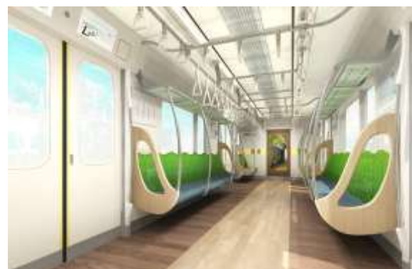
▲6020系 インテリアイメージ