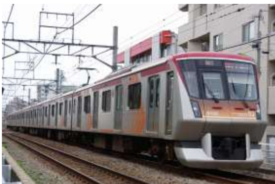
▲7両化される急行専用車両6000系

安全・安心に利用できる鉄道を目指し、ホーム上の安全対策として、2019年度までに東横線・田園都市線・大井町線全64駅のホームドア整備を目指しています。今年度大井町線では、荏原町駅および九品仏駅でホームドアの運用を開始する予定のほか、荏原町1号踏切や緑が丘3号踏切には、3D式踏切障害物検知装置に更新を行うなど、路線全体の安全対策の強化を進めます。