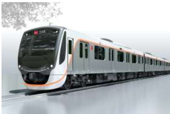
▲6020系 エクステリアイメージ