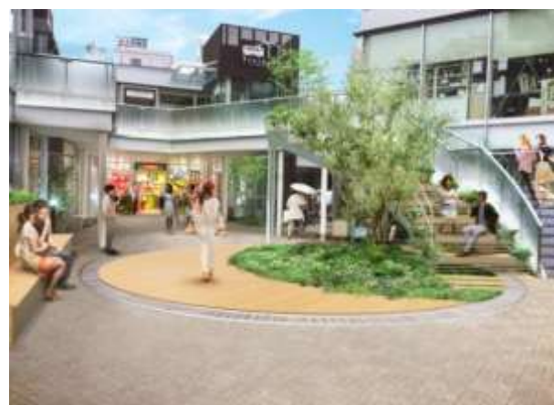
【中央広場イメージ】