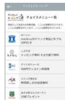
メニュー一覧画面イメージ