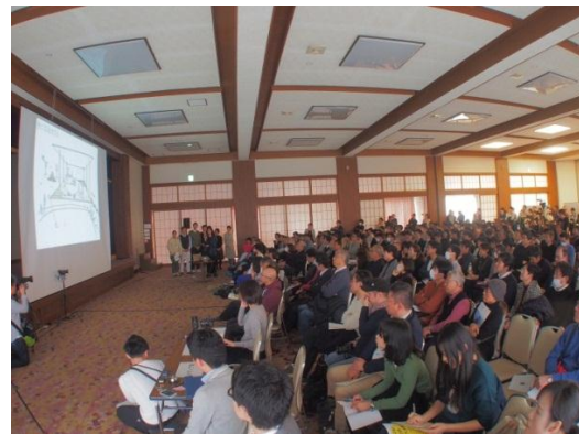
提案プレゼンテーション風景