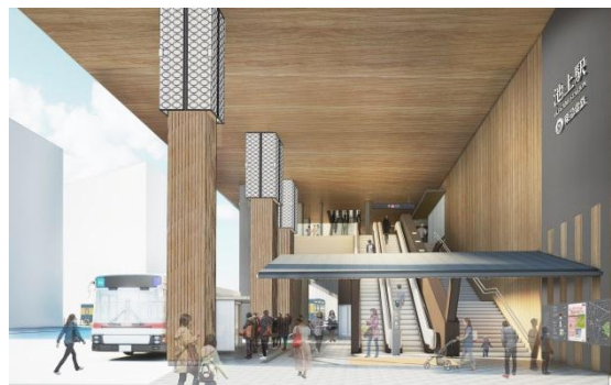
北側の駅出入口イメージ