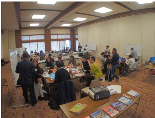
ユニットワーク中の様子

具体的には、温泉施設の2階宴会場の“まちの劇場”(朝・昼＝子どもやママ友向け、夜＝ジャズ演奏や映画上映など)としての活用、公園内の使われていない資材置き場の“木工カフェ”活用、寺院敷地内の納屋のコミュニティカフェ・コワーキングスペース・レンタルスペースの複合用途活用、駅前商店街空き店舗のワークショップスペース・立ち寄りカフェ&バーとしての活用などの提案がまとめられました。