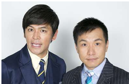
「インターナショナル仮装コンテスト」 特別ゲスト『ますだおかださん』