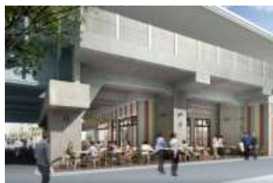
【目黒川沿いテラススペースイメージ】