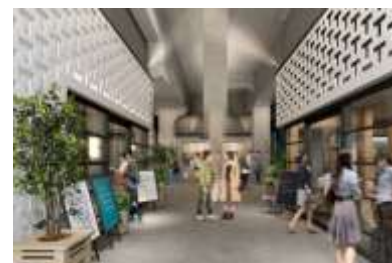
【山手通り沿い施設内イメージ】

当社は、東京地下鉄株式会社と共同で、「中目黒高架下」(以下、本施設)を2016年11月に開業します。このたび、本施設の名称、ロゴ、および出店する全28店舗が決定しました。