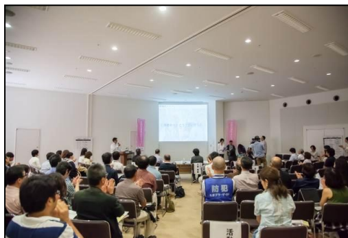
活動報告会の様子