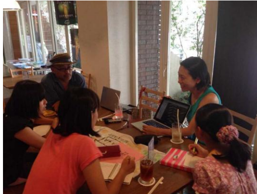
昨年実施したインタビューの様子