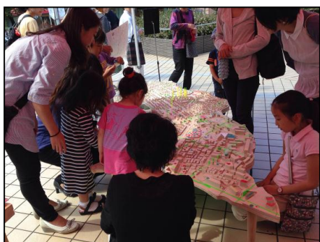
住宅街を舞台にしたアートプロジェクト 「AOBA+ART2014展」

本プログラムにおいて、「街のはなし」の取材・冊子制作等を担当する「AOBA+ART」は、「次世代郊外まちづくり 住民創発プロジェクト」で支援した団体の一つです。昨年度は、美しが丘中学校の1年生を対象とした「街のはなし」の取組みも行い、美しが丘中学1年生を対象に開講した「アオバアート・ゼミ」のゼミ生が同行し、5歳から80歳代の地域住民11人にインタビューを実施しました。