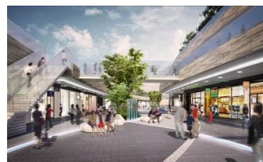
▲テラスマーケットイメージ①