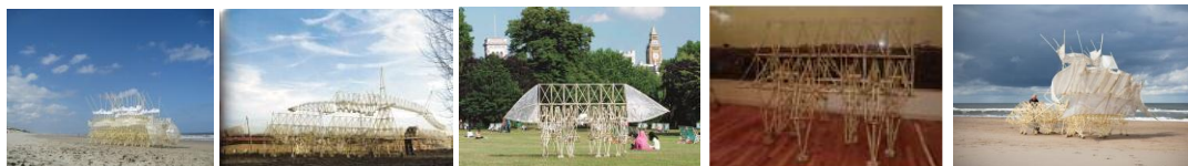
左から Animaris Siamesis, Animaris Percipiere Primus, Animaris Ordus(A), Animaris Ordus(B), Animaris Plaudents Vela