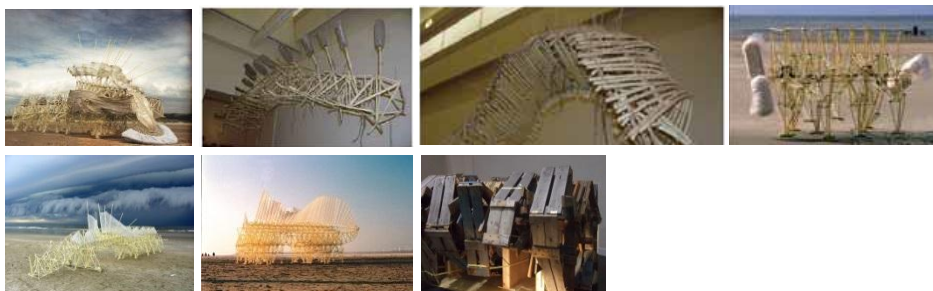
左上から Animaris Percipiere Primus, Animaris Varmiculus, Animaris Rugosus Paristhatis, Animaris geneticus-1997, Animaris Percipiere Rectus, Animaris Currens Ventosa, Animaris Rhinoceres Tabulae