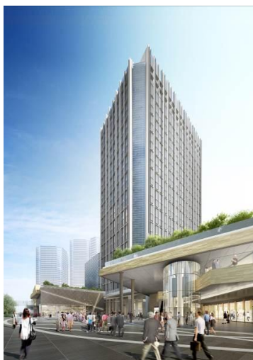
▲高層棟外観イメージ