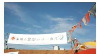
▲ENNICH by 太陽と星空のサーカス

ライブパフォーマンス、ワークショップ、マルシェ、映像作品の上映などを組み合わせた複合型イベントを開催。シンガーソングライター・bird(バード)などのアーティストによるライブのほか、「青空靴磨き教室」や移動式帽子屋「AURA」など、ワークショップ、雑貨、フードなど幅広いジャンルの約200のコンテンツが“縁日”を盛り上げます。