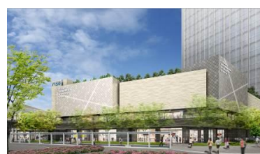
▲テラスマーケットイメージ②