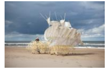
▲ストランドビースト「Animaris Plaudents Vela」

オランダの彫刻家・物理学者であるテオ・ヤンセン氏の世界的に有名な“風を食べて動く(=風力のみで生物のように可動する)”アート作品「ストランドビースト」を、商業施設として世界で初めて招致します。また、二子玉川ライズ内のデモンストレーションのみならず玉川高島屋 S・Cでも展示。テオ・ヤンセン氏本人の来場も予定しています。