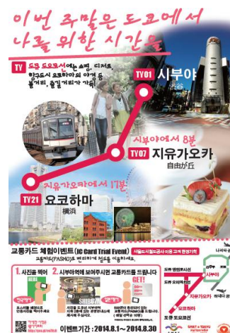
SMRT社線掲出ポスター

（参考）本日、この資料は国土交通記者会、ときわクラブ、霞クラブ、経済産業記者会にお届けしています。