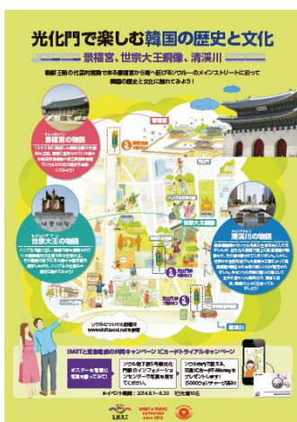
当社線掲出ポスター