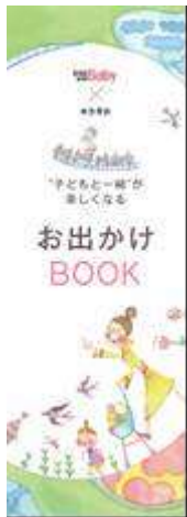
「AERA with Baby × 東急電鉄 “子どもと一緒に”が楽しくなる お出かけ BOOK」 (ダイジェスト版)表紙イメージ