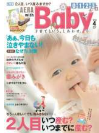
「AERA with Baby」4月号 表紙イメージ