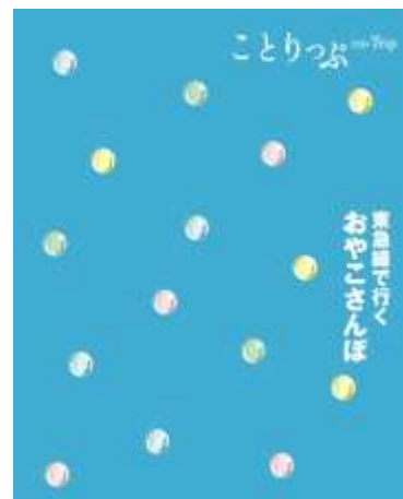
「ことりっぷ 東急線で行く おやこさんぽ」 表紙イメージ