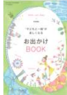
特別付録 表紙イメージ