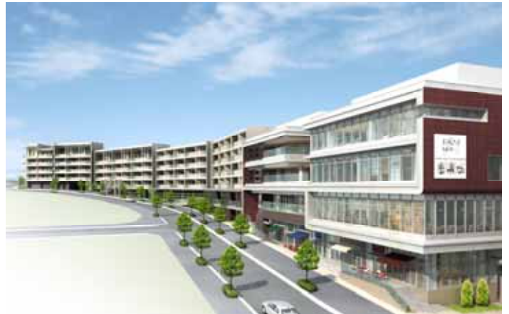
全体外観 イメージパース 手前:たまプラーザ テラス リンクプラザ(本施設) 奥:ドレッセ たまプラーザ テラス (分譲マンション:一部店舗区画あり)