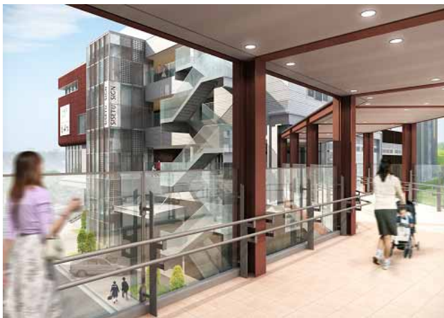
ペDESTリアンデッキ部分 イメージパース