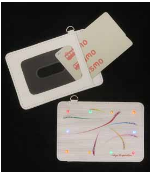
ICカードは入っておりません。