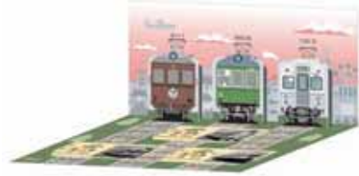
記念入場券イメージ