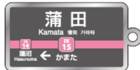
キーホルダーイメージ