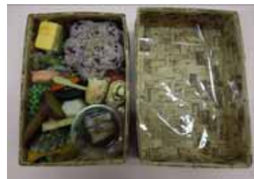
(オリジナル記念駅弁「池めし(いけめし)」イメージ)