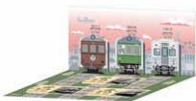
(記念入場券イメージ)