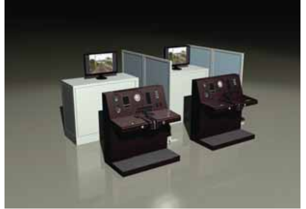
田園都市線(実写版)