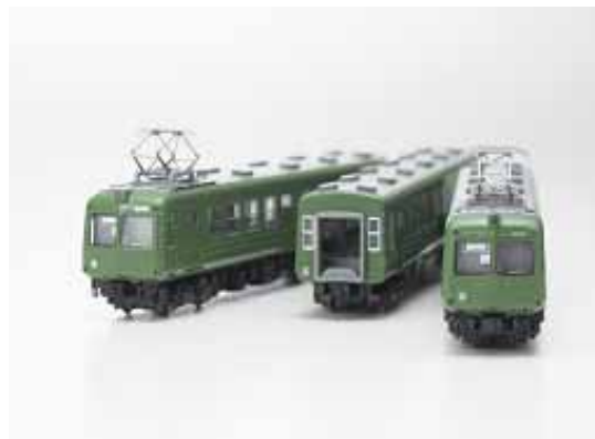
5000系(初代)Nゲージ模型(数量限定)

プラレールをはじめとした鉄道玩具や鉄道模型、東急線グッズや三陸鉄道をはじめとした東北地方の鉄道グッズの数々など、多彩なグッズを取り揃えます。中でも特筆すべきは、東京急行電鉄5000系(初代)Nゲージ模型の復刻モデル。1,500セットを会場限定で販売します。