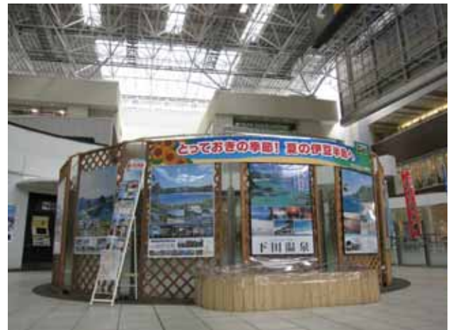
(左)ミスによる「伊豆のなつ号」内でのパンフレット配布と、(右)東急たまプラーザ駅構内の「観光PRディスプレイ」(昨年の様子)