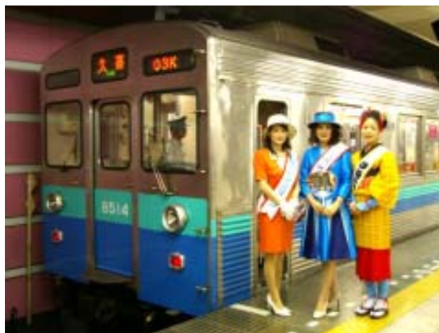
(左)ミスによる「伊豆のなつ号」内でのパンフレット配布と(右)伊豆急カラーに塗装した東急8500系(昨年の様子)