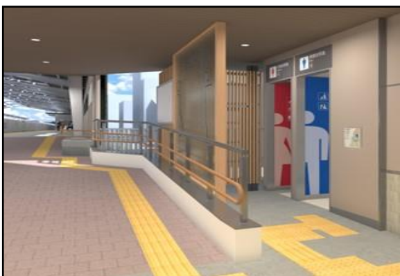
▲尾山台駅溝の口方面ホーム構内トイレ (外観イメージ)

※2 脱炭素・循環型社会の実現に向けた「環境ビジョン2030」を策定： 詳細はこちら