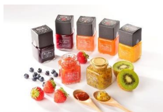
手作り工房Poco a Poco