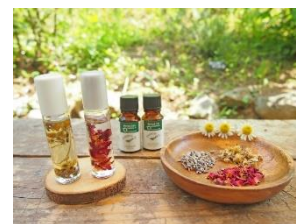
アカオハーブ&ローズガーデンハーブ工房