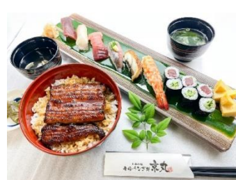
日本料理 寿司・うなぎ処 京丸 三島店