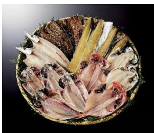
ふじのくにさすよ