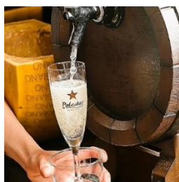
ワイン食堂 VINSENT 三島店