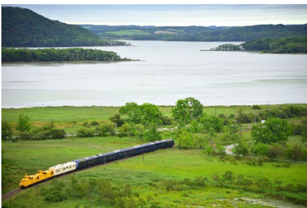
【THE ROYAL EXPRESS】

絵柄を「THE ROYAL EXPRESS ～HOKKAIDO CRUISE TRAIN～」または「HOKKAIDO LOVE! ひとめぐり号」運行時のフラッグに使用する予定です。