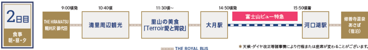
里山の美食「Terroir 愛と胃袋」