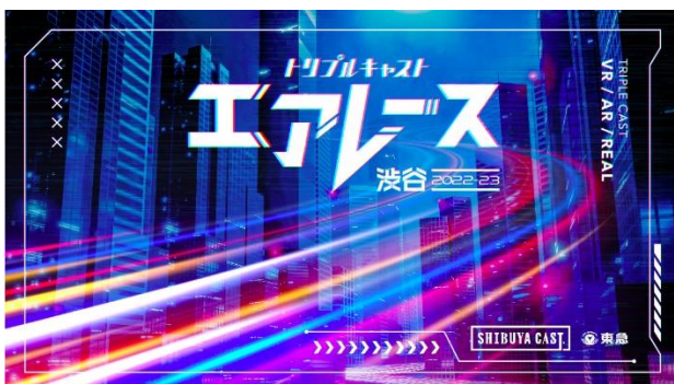
▲「エアレース渋谷2022—2023」キービジュアル

当社は、エンタテインメントやクリエイティブ・コンテンツが街に集まり、公共空間などで展開され、それを楽しむ人々が街がにぎわうことを目指したビジョン「エンタテインメントシティSHIBUYA」を掲げています。今後も、本プロジェクトをはじめとして、「リアル」「バーチャル」両方の視点を持ち、都市空間の新しい使い方を提供することで、「エンタテインメントシティSHIBUYA」のさらなる進化を推進していきます。