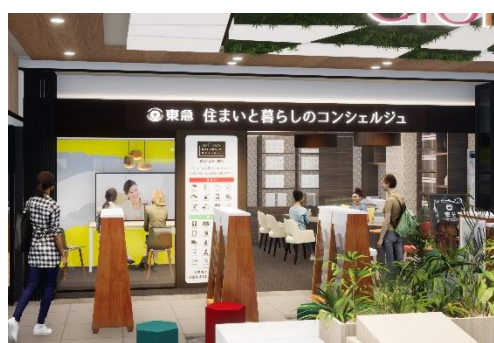
▲エトモ大井町店イメージ