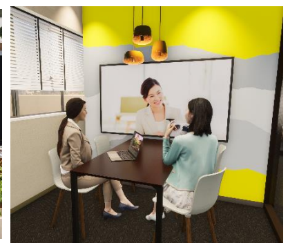
▲リモートカウンターイメージ