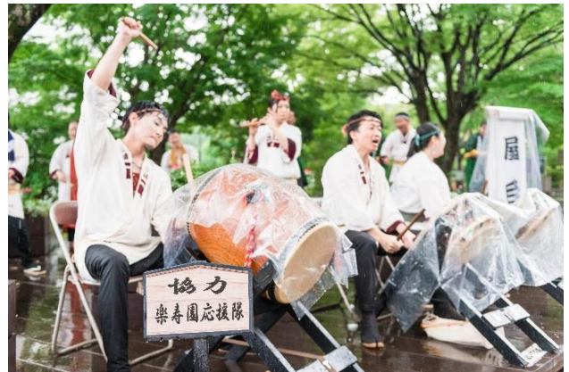
▲隣接する楽寿園前で行われた町内会による「しゃぎり」の様子