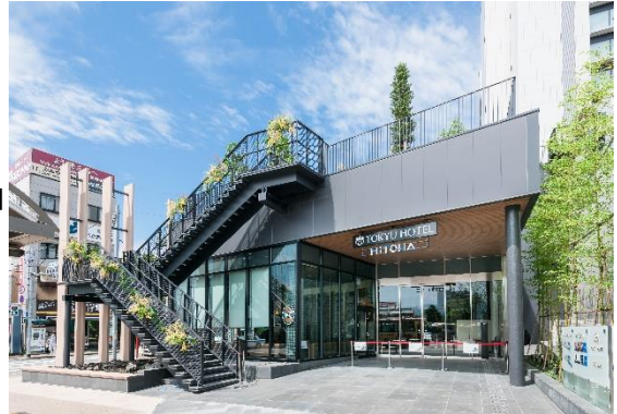
▲商業施設「ミトワみしま」1階エントランス

https://www.tokyu.co.jp/tokyu/mitowa-mishima/