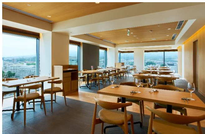
▲13階レストラン「炉 L' EAU」【源兵衛】