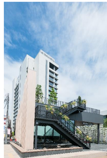
▲「東急三島駅前ビル」外観