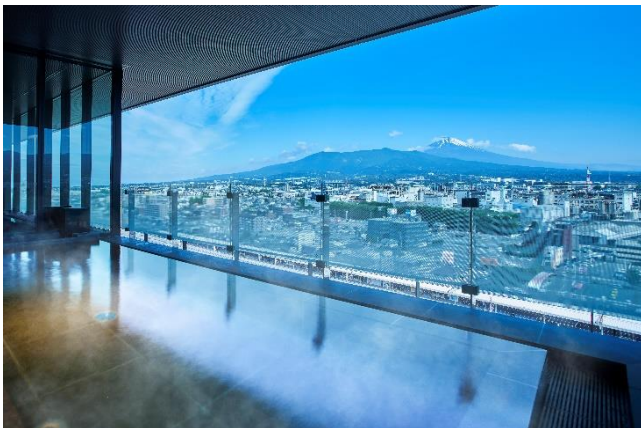
▲展望温浴施設「富士の湯」日中の様子