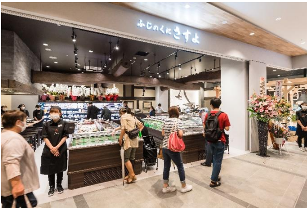
▲商業施設「ミトワみしま」1階の様子