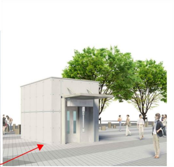
【21番EV完成イメージパース】