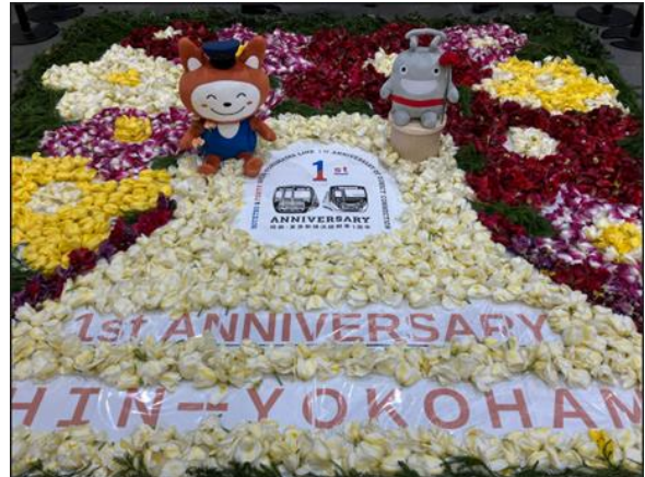
▲展示イメージ(2024年4月新横浜駅)