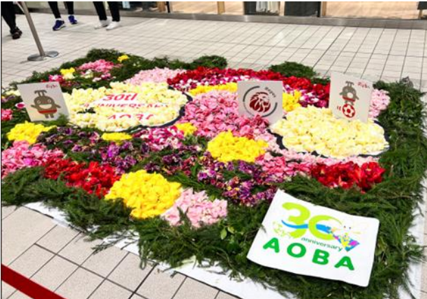
▲展示イメージ(2024年4月青葉台駅)