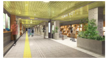
▲駒沢大学駅リニューアルイメージ(コンコース)