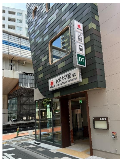
▲新設エレベーター