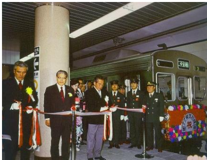
▲新玉川線開通式(1977年)

田園都市線地下区間の5駅(池尻大橋駅・三軒茶屋駅・駒沢大学駅・桜新町駅・用賀駅)は、当社初の地下鉄である「新玉川線」として1977年に開業しました。新玉川線は、ステンレス車両や、各駅で異なるステーションカラーの導入、駅冷房等を考慮した駅づくりなど、当時としては先進的な地下鉄でした。