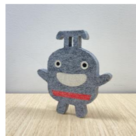
▲クリスマスオーナメントのイメージ

https://www.green-display.co.jp/info/column/info-691/