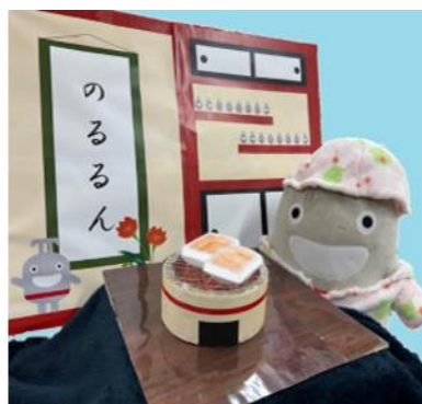
2022 年冬開催の装飾大会 投票 TOP3