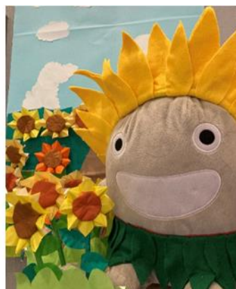
2022 年夏開催の装飾大会 投票 TOP3