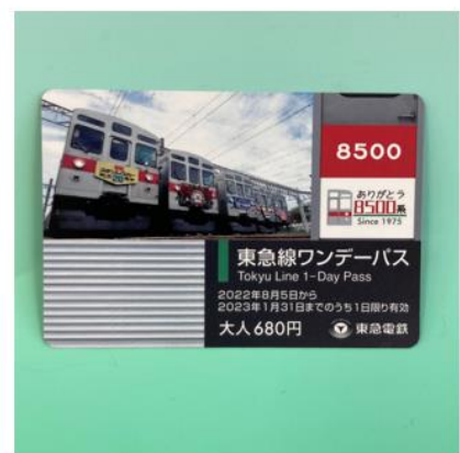
▲東急線ワンデーパス