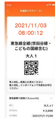
▲電子乗車券券面イメージ