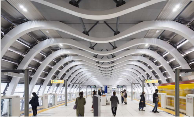
▼東京メトロ銀座線渋谷駅