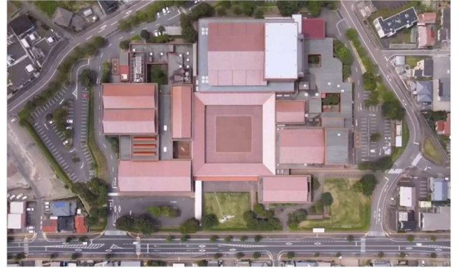
▼島根県芸術文化センター(グラントワ)