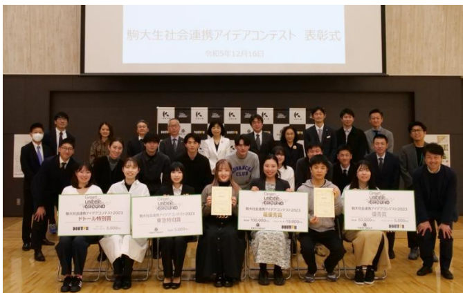
▲本コンテスト 最終審査の様子

https://www.komazawa-u.ac.jp/social/about/komadaiproject/socialidea/si-2023-result.html