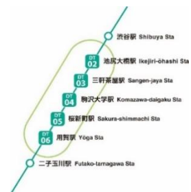
▲田園都市線地下区間5駅 リニューアル対象駅