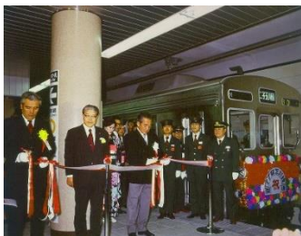
▲新玉川線開通式(1977年)

田園都市線地下区間の5駅（池尻大橋駅・三軒茶屋駅・駒沢大学駅・桜新町駅・用賀駅）は、東急電鉄初の地下鉄である「新玉川線」として1977年に開業しました。新玉川線は、ステンレス車両や、各駅で異なるステーションカラーの導入、駅冷房等を考慮した駅づくりなど、当時としては先進的な地下鉄でした。