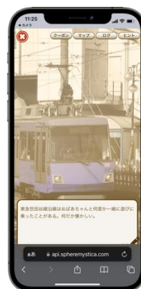
【WEBアプリ画面イメージ】