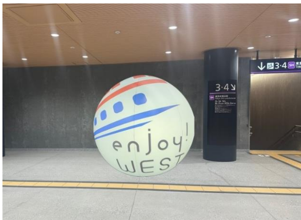
▲本映像ショーイメージ(一例)