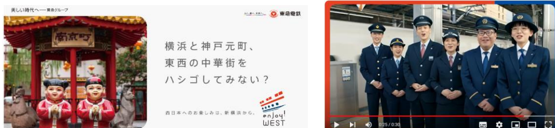
▲車内掲出ポスターと放映動画(一例)