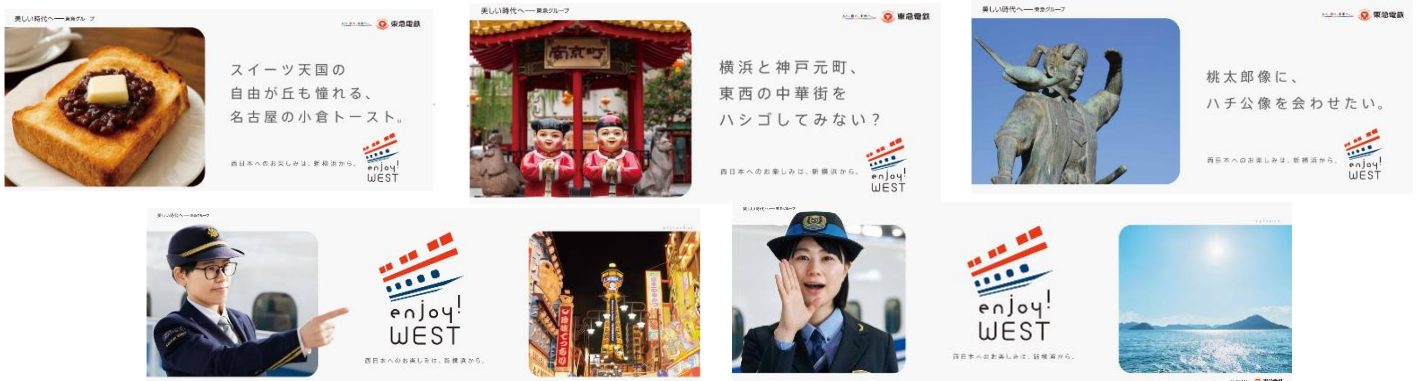
▲車内で掲出するポスター（一例）