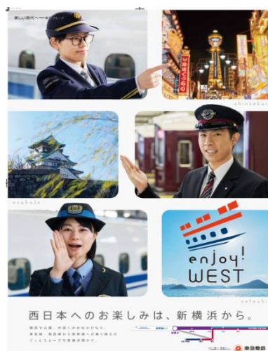
▲駅貼りポスター（一例）