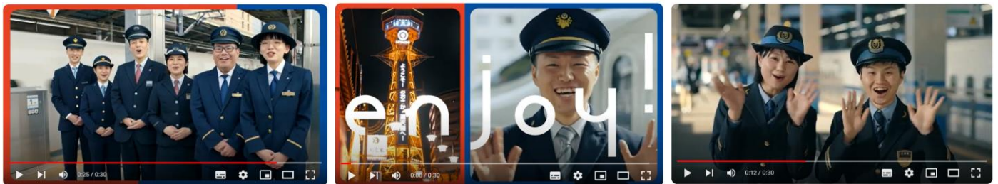
▲車内で放映する動画（一例）