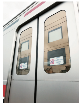
飛散防止フィルム

車両ドアは、ドアガラス破損防止のため4mm・5mm厚の強化ガラスおよび複層ガラスを使用しています。また、4mm厚強化ガラスに対しては割れたガラスが飛散しないように透明の飛散防止フィルムを貼り付けて安全性向上を図っています。飛散防止フィルムには夏場の遮熱、冬場の断熱にも高い効果があり、空調消費電力量を削減し省エネ効果もあげています。