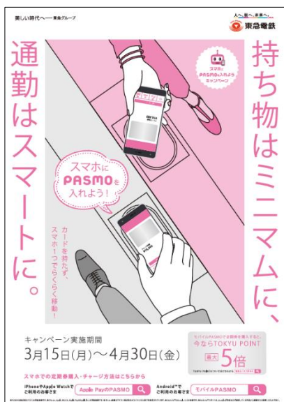
▲本キャンペーンビジュアル

詳しくは、こちらをご覧ください https://www.topcard.co.jp/point/index.html