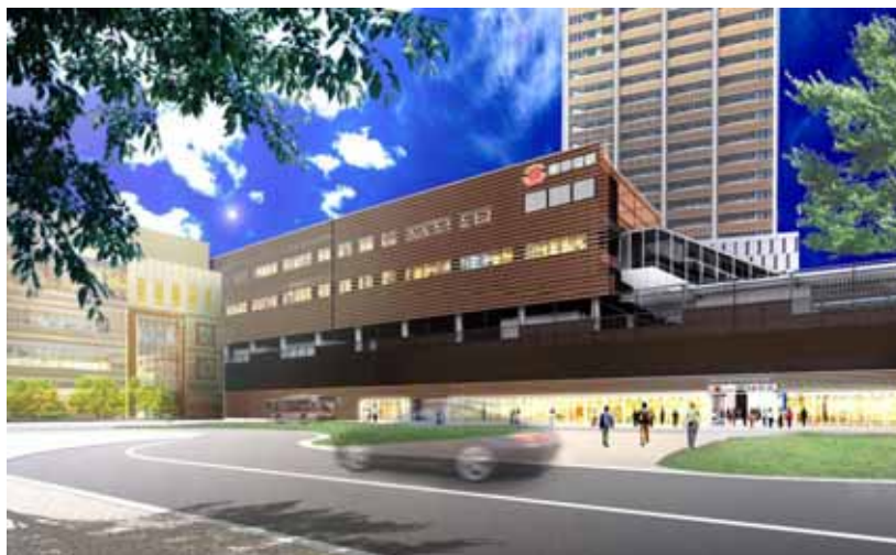
東急武蔵小杉駅ビル 外観イメージパース（実際の計画と異なる場合があります。）