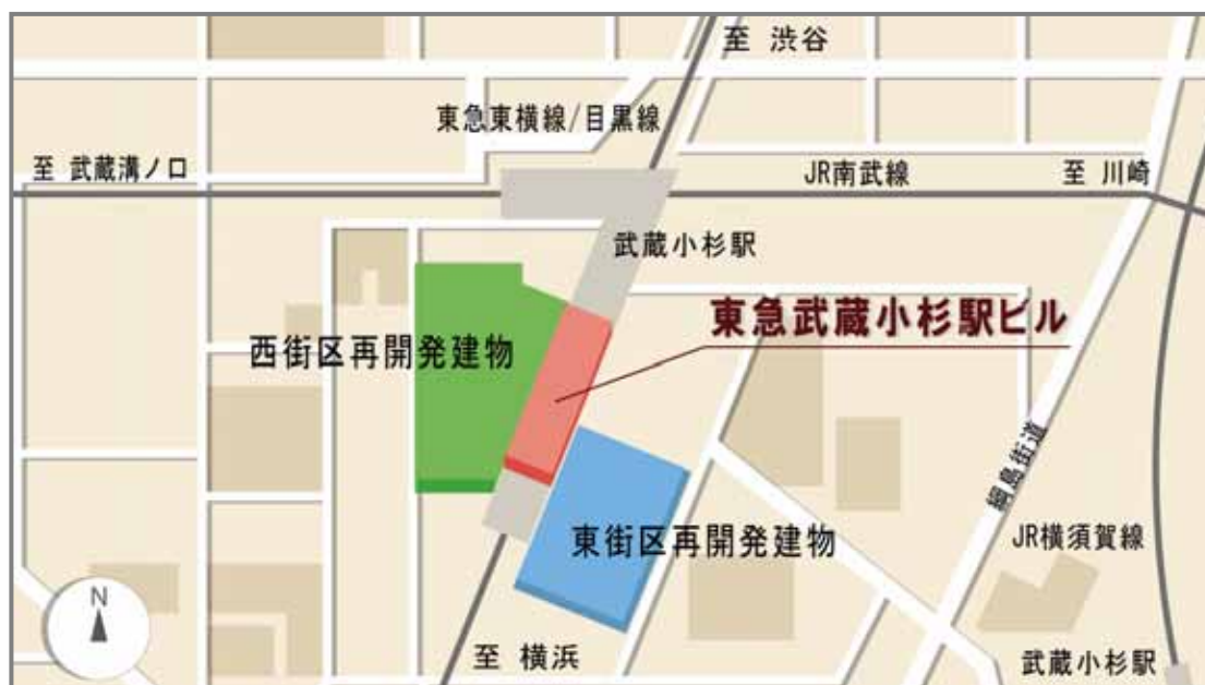
東急武蔵小杉駅ビルおよび隣接再開発建物の配置図