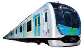
使用車両:西武鉄道新型通勤車両「40000系」