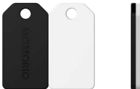
落とし物追跡タグ「MAMORIO」

※近距離無線通信規格 Bluetooth 4.0 の呼称。2016年現在、多くのスマートフォンデバイスが本規格の送受信に対応しており、「低消費電力」、「低コスト」を特徴としている。