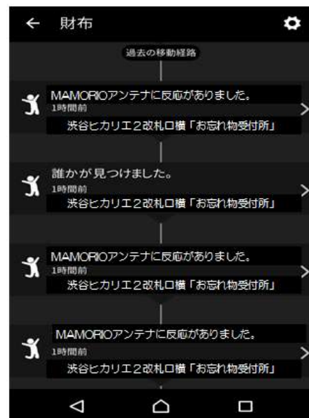
▲位置情報通知のイメージ