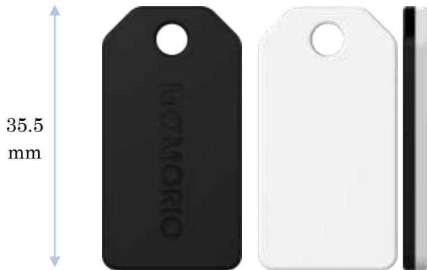
▲ 落とし物追跡タグ「MAMORIO」