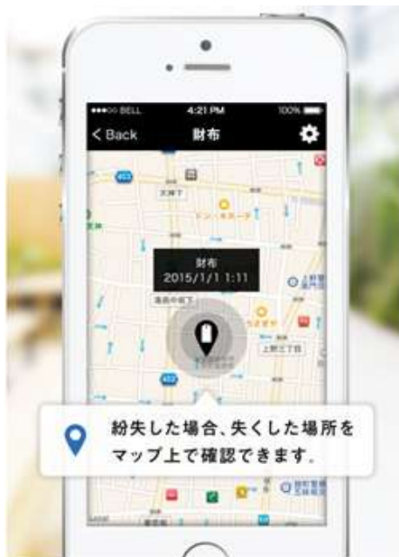
▲お忘れ物通知のイメージ