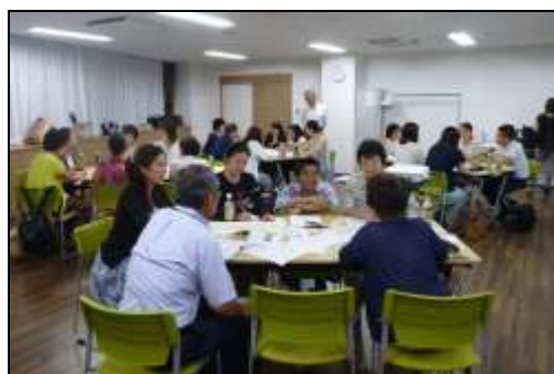
子ども・子育てタウンミーティングの様子

モデル地区において、保育・教育・子育て支援等に携わる多様な主体が参画した「子ども・子育てタウンミーティング」を4回開催しました。より子育てしやすいまちづくりの実現を目指し、保育・子育てに関わる様々な主体が連携・協働していくための顔の見える場づくりの検討を進めました。