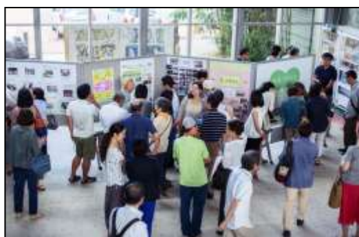
「次世代郊外まちづくりフォーラム」の様子