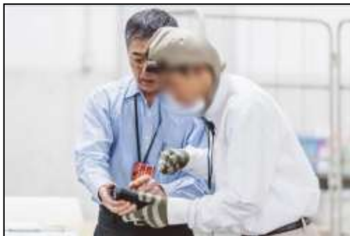
美しが丘中学校「職場体験」授業の様子

平成28年3月には、美しが丘中学校2年生（当時）による発表会「次世代郊外まちづくり シビックプライド ～美中生が考える 明日のわがまち～」を開催し、シビックプライドの醸成と次世代のまちづくりの担い手育成につながりました。