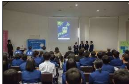
美しが丘中学校「発表会」の様子