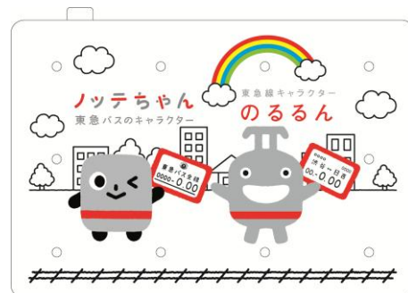
「光る！パスケース」(案)